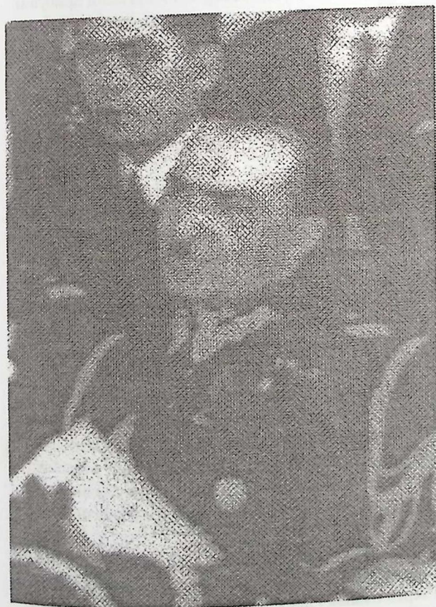
Фото 3. Генерал Вільгельм Орлік-Рюккеман. Командир групи КОП.