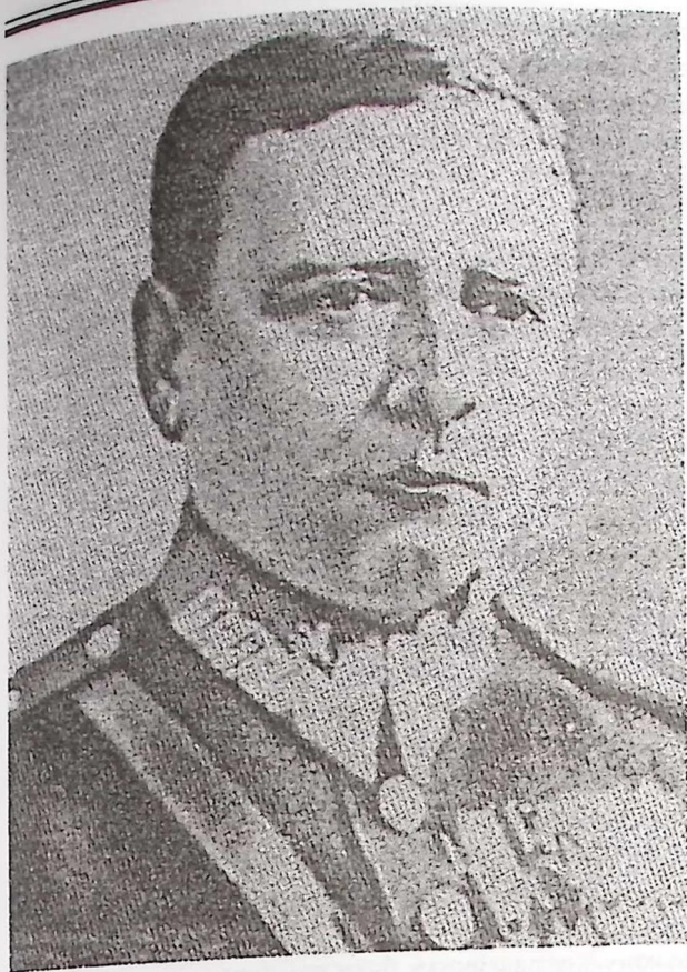
Фото 1. Генерал Францішек Клеєберг.