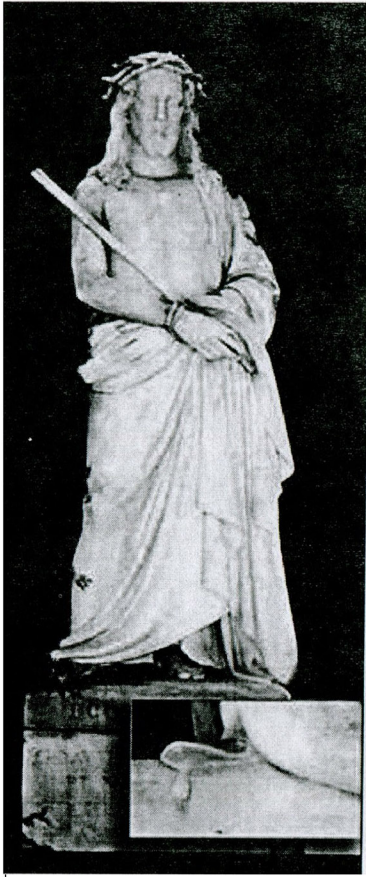
Скульптура «Ессе Номо»

Образ Христа в композиції «Піста» із Рівненського краєзнавчого музею доповнюють постаті Марії та Іоанна Богослова, втілюючи скорботу матері та учня від втрати єдиного сина і улюбленого вчителя. Об'єднують всі три постаті хрест - символ страждання і спасіння. Скульптор декілька разів повторював «Пісту». Дві мармурові скульптури та дві гіпсові моделі її зберігаються у Римі 25 . Репліка майстра з Рівненського музею походить із села Межиричі Корецькі, де була поставлена як меморіальний пам'ятник на могилі сім'ї Рудницьких, знайомих скульптора, яким належав маєток у селі Руцці Рівненського повіту 26 .