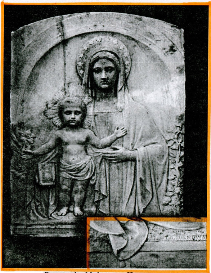
Барельєф «Мадонна з Немовлям»