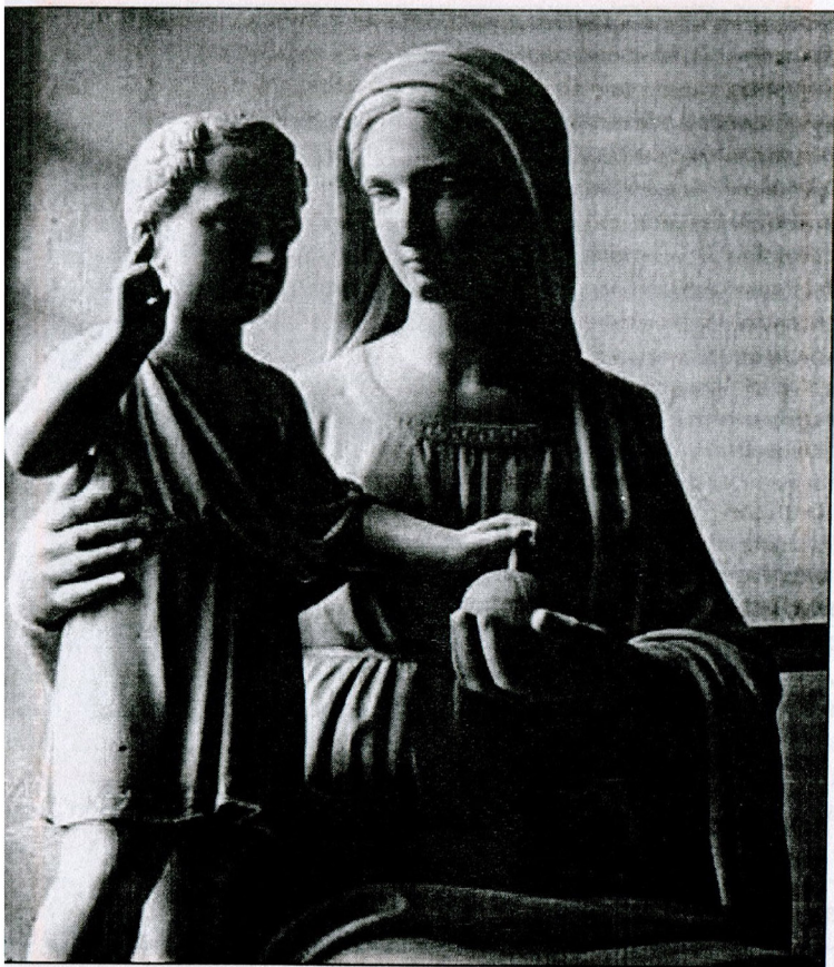
Скульптура «Мадонна з Немовлям»

Новим кроком у вирішенні теми материнства в творчості Сосновського стала композиція «Материнство матері» (середина 1850 р.), що знаходиться у польському колеґіумі в Римі 19 . У 1855 р.,