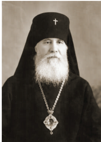
Єпископ Йоан Лавріненко