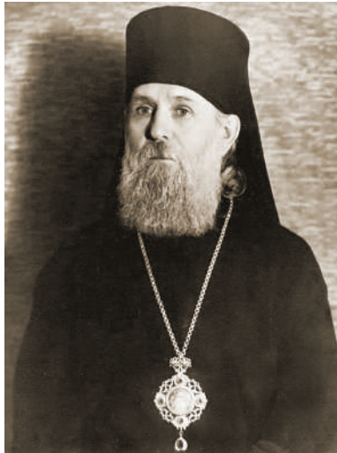
Єпископ Федір Рафальський