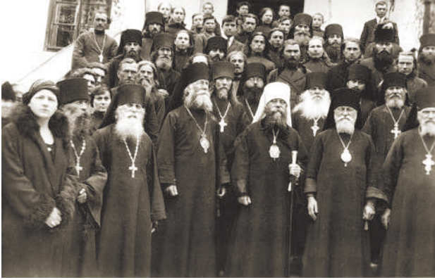
Митрополит Діонісій Валединський (у центрі в білому клобучку). Праворуч – єпископ Полікарп Сікорський. Ліворуч – архієпископ Пантелеймон Рожновський. Почаївська лавра, 1936 р.