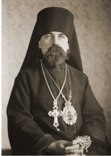
Єпископ Платон Артемюк