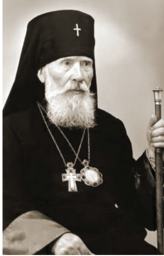
Єпископ Сильвестр Гаєвський