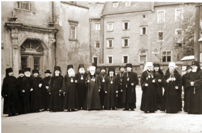
Православні єпископи на Вавельському замку. Краків, травень 1944 р.