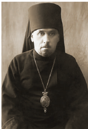
Єпископ Тимофій Шреттер. Кінець 1930-х рр.