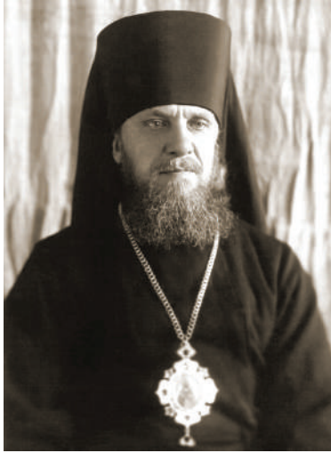
Єпископ Йов Кресович