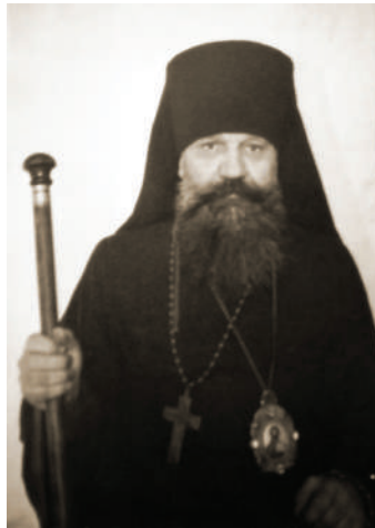
Єпископ Григорій Огієчук