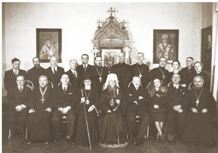
Митрополит Діонісій Валединський (у центрі в білому клобучі) серед українських церковних і політичних діячів. Варшава, 1941 р.