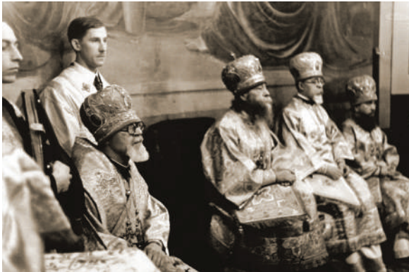
Єпископи Православної Церкви в Генерал-губернаторстві. Сидять зліва направо: архієпископ Палладій Видибіда-Руденко, митрополит Діонісій Валєдинський, архієпископ Ларіон Огієнко, єпископ Тимофій Шреттер. Варшава, 2 лютого 1941 р.