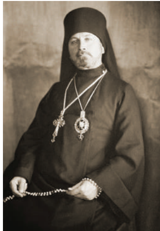
Єпископ В'ячеслав Лісицький