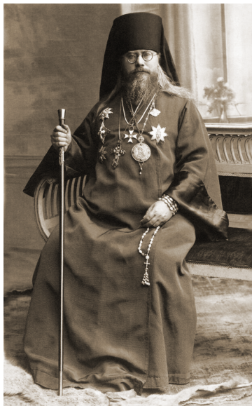
Архиепископ Олексій Громадський. Початок 1930-х рр.