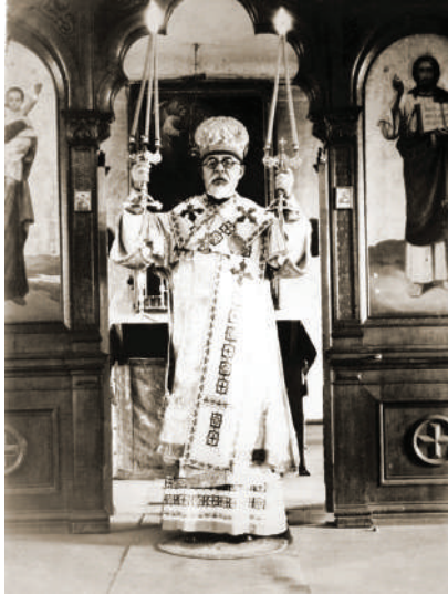
Архиепископ Ларіон Огієнко. Холм, 1940 р.