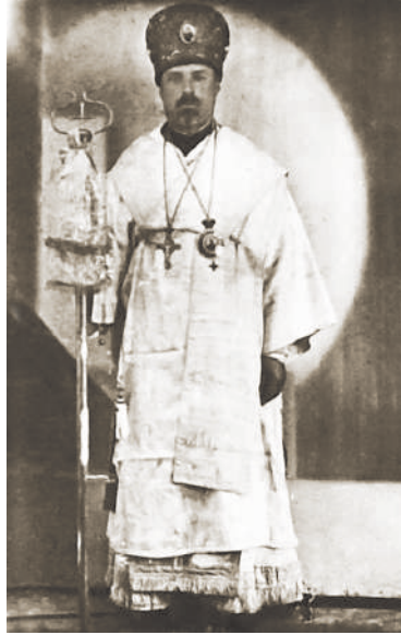
Єпископ Фотій Тимошук