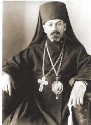
Єпископ Мстислав Скрипник