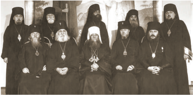
Єпископат Польської Автокефальної Православної Церкви. Сидять зліва направо: архієпископ Олексій Громадський, архієпископ Феодосій Феодосьєв, митрополит Діонісій Валединський, архієпископ Олександр Іноземцев, єпископ Сава Советов. Стоять зліва направо: єпископ Матвій Семашко, єпископ Полікарп Сікорський, єпископ Антоній Марценко, єпископ Симон Івановський, єпископ Тимофій Шреттер. Варшава, 1939 р.