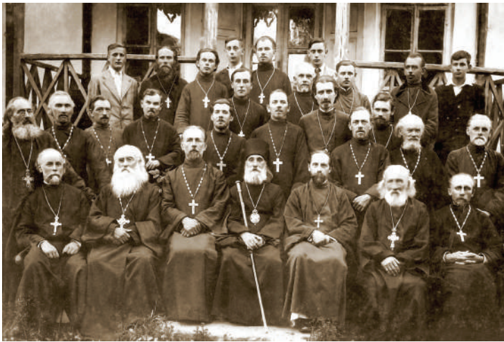
Архиепископ Симон Івановський з острозьким духовенством. 1941 р.