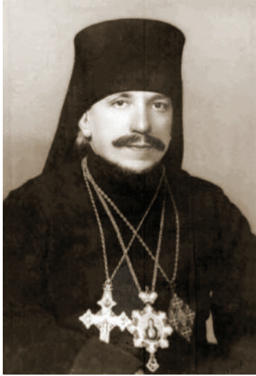
Єпископ Пантелеймон Рудик