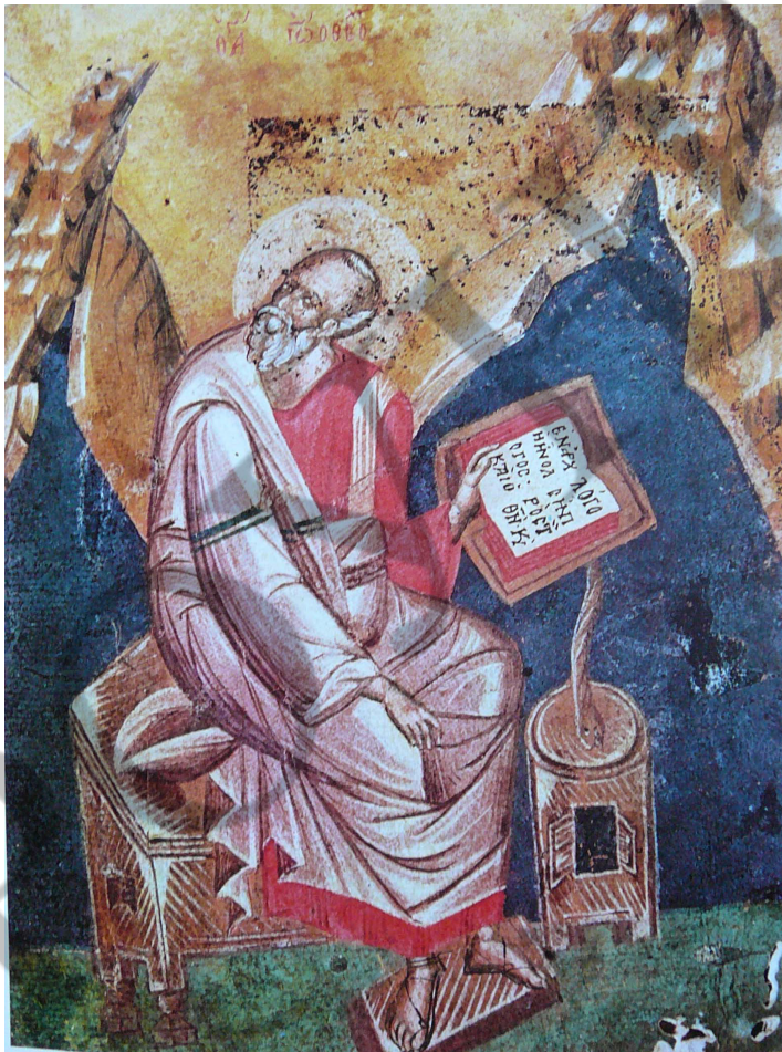
Свангеліст Йоан на острові Патмос. Афон, монастир Діонісіат

зокрема, здатне доводити певну їх часову спорідненість, водночас пропонуючи варте уваги уточнення до тільки загально досі визначеного в межах усього століття часу створення зазначеного анонімного рукопису.