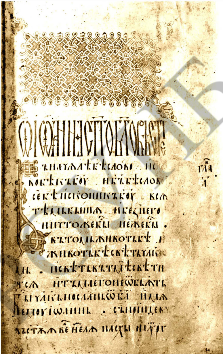
Титул Євангелія від Йоана