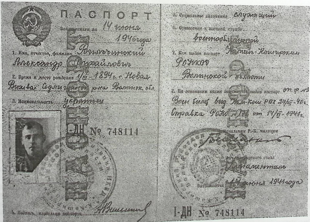
Паспорт священника Александра Вільчинського.