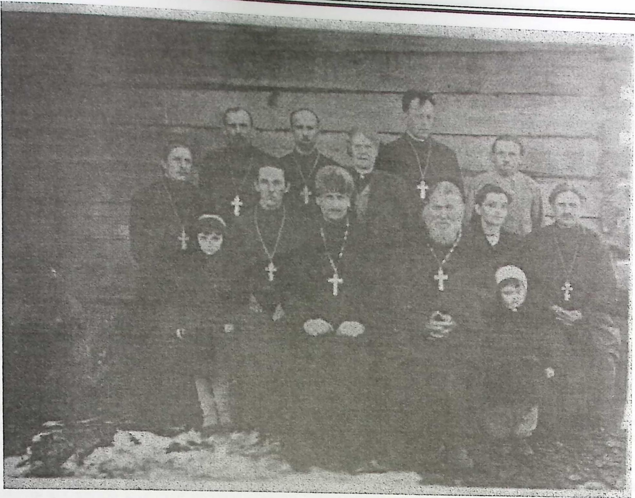
Сповідь окружного духовенства Старовижівського благочинного округу. 1949 р.

пропозицію єпархіального керівництва і в 1947 році єпископом Волинським і Ровенським Варлаамом (Борисевич) був рукоположений в сан диякона і священника й призначений на парафіяльне служіння до Нової Вижви.