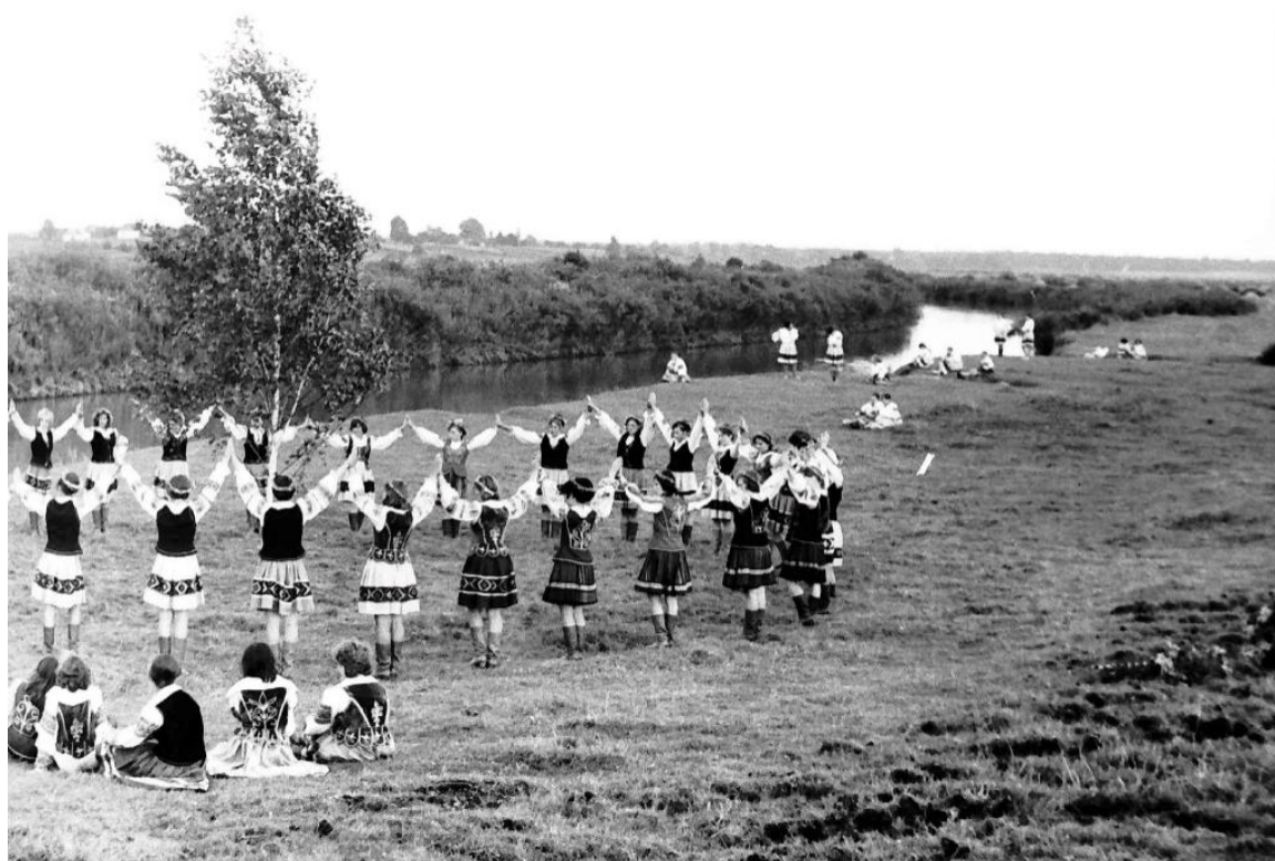
Зйомки фільму на березі річки Стир у 1970 р.

Купальське свято в Україні має глибоке коріння, широке побутування і багато місцевих особливостей. Традиції святкування Івана Купала, характерні для Рожищенщини, у певних варіаціях дожили до наших днів. А в 1970 р. на березі річки Стир у м. Рожище був знятий документальний фільм про святкування тут Івана Купала. У періодичних виданнях є різні думки щодо самого фільму/фільмів і часу його/їх зйомки. Є інформація про те, що фільм «На щастя, на долю» знімався у м. Рожище 1969 р. на замовлення канадської діаспори кіностудією імені Довженка [12]. Однак свято знімалось 1970 р. Українською студією хронікально-документальних фільмів (режисер Роман Фоменко, кінооператор Віталій Гура). У соціальній мережі (сторінка: Рожищенський край. Фотоподорожі в минуле) опубліковані світлини, на яких зафіксовані окремі моменти зйомок фільму біля річки Стир і в Копачівському лісі.