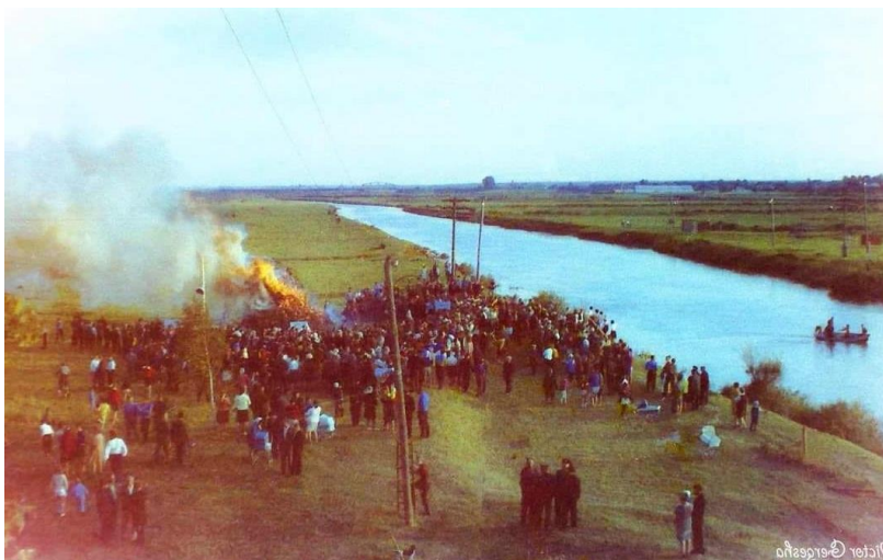
Свято Івана Купала в Рожищі 6 липня 1969 р. на правому березі Стиру.

Звернемо увагу на зміни у місцях проведення свята. Де сьогодні відбуваються купальські святкування? У м. Рожище дійство проходить на березі Стиру. Як пригадують старожили, спочатку свято влаштовували на лівому березі річки Стир, безпосередньо на міському пляжі. Пізніше (коли???) святкування перенесли на правий берег річки – по обидва боки від мосту через Стир [11]. У фільмі частину обрядів знято на березі річки Стир, частину – у Копачівському лісі.