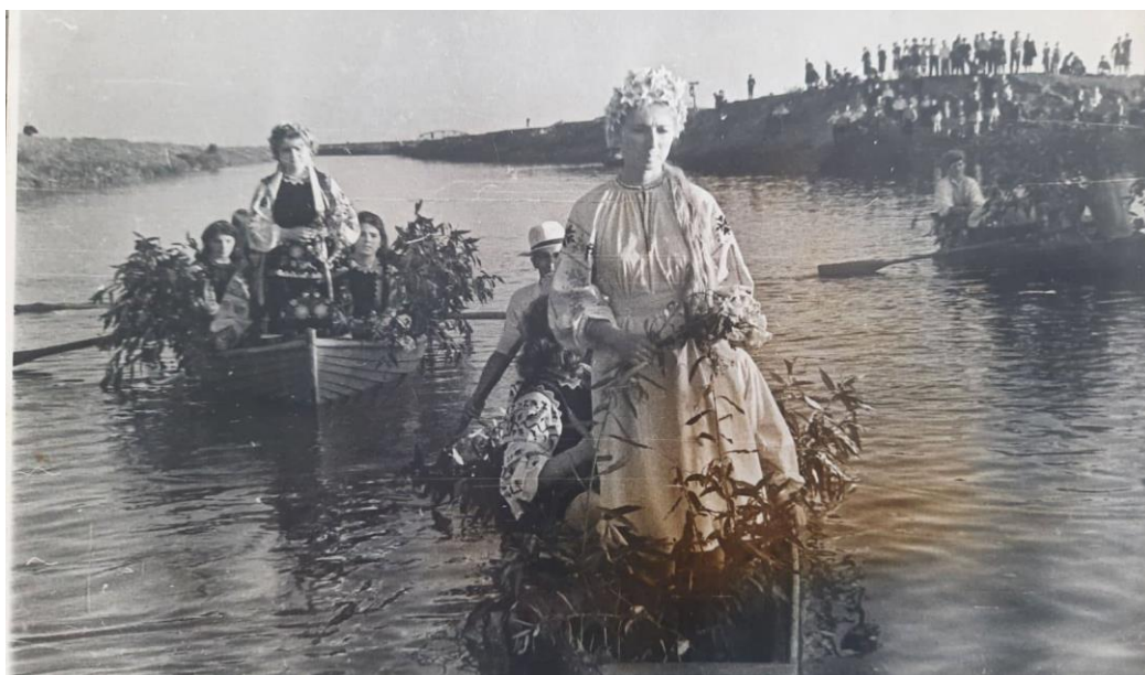
Марена з гілками верби річкою Стир прибуває на свято

Наступний аспект – хто підпалює купальські багаття? (Правда, купальське багаття в Рожищі під час святкування 2001 року назване чомусь «козацьким» [7]). Опис дійства 1960-х роках у м. Рожище: «До місця проведення купальського торжества наближається флотилія човнів, прикрашених квітами. На передньому плані – Іван Купала у вишитій сорочці, шароварах та смушковій шапці, Русалка, Водяний, їх зустрічають хлібом-сіллю учасники купальського свята, а один з ветеранів праці вітає прибулих такими словами: “Дорогі друзі! Сьогодні у нас свято Івана Купала. Це свято юності, краси, життєрадісних пісень. Веселіться, танцюйте, співайте!”. Іван Купала запалює вогнище, біля якого дівчата водять хороводи, танцюють, веселяться...» [5, с. 114–115; 8, с. 5]. Як пригадують старожили м. Рожища, «Завершувалось свято прибуттям Нептуна з лісовими мавками та палінням величезного вогнища» [12]. До традиційних атрибутів додалися Іван Купало / Купала, лісові мавки і русалки, водяні, чорти, а ще Нептун.