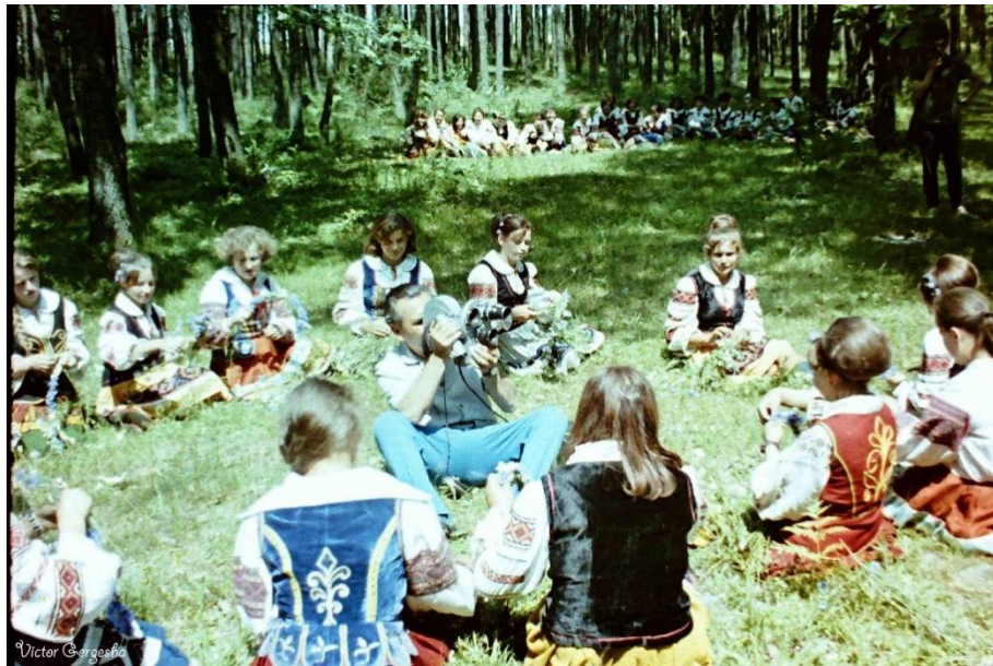
Зйомки фільму в Копачівському лісі.

Свято Купала / Івана Купала було доволі поширеним на Волині, хоча про давні звичаї і обряди, приурочені до цього дня, тепер мало хто пам'ятає. Саме території Волині стосується і найдавніша писемна згадка про свято Купала в Україні, датована 1262 роком. Її зафіксував Волинський літопис: «канунъ Івана дни, на самыє Купалья» [5, с. 8]. Тодішня церква не сприймала давнє народнє свято і всіляко таврувала його. Особливо старалися полемісти кінця XVI – початку XVII ст. Іван Вишенський наполягав: «Купала на Хрестителя утопите і огненне скакання відкиньте, гнівається-бо Хреститель на землю вашу, що в день пам'яті його попускаєте дияволу глумитися вами з вас же самих» [5, с. 9–10]. Назва Івана Купала, яка сьогодні часто заперечується як така, що не має жодного стосунку до свята Різдва Івана Предтечі, виникла якраз під впливом християнства – свято Івана наклалося на давній дохристиянський обрядовий цикл.