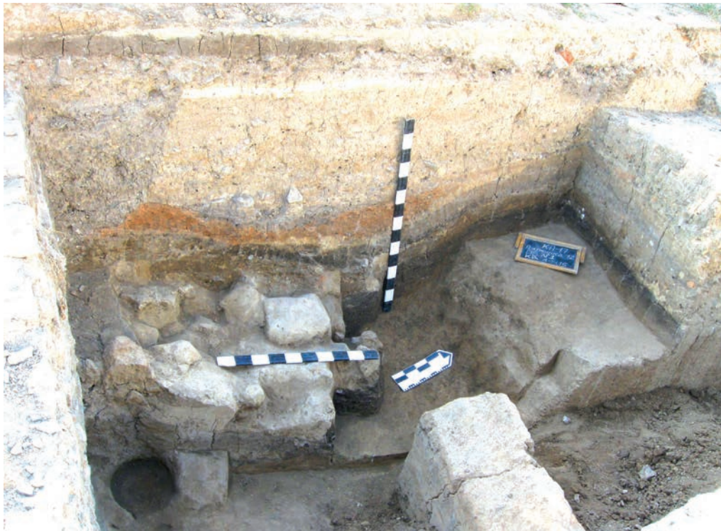
Ілюстр. 2. Залишки валькованого житла по вул. П'ятницькій, 12 у Кам'янці-Подільському