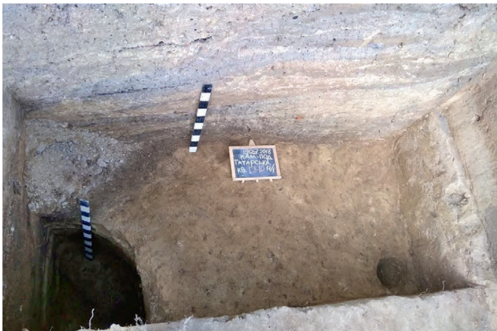
Ілюстр. 3. Залишки житла каркасно-стовпової конструкції та яма-холодня з вул. Татарської, 17/1 у Кам'янці-Подільському