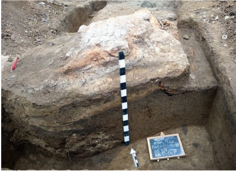
Ілюстр. 13. Залишки гончарного горна з вул. Татарської, 17/1 у Кам'янці-Подільському