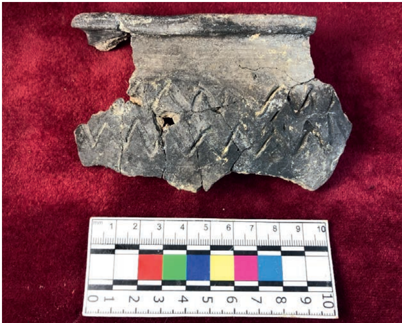
Ілюстр. 14. Фрагмент горщика другої половини XIV ст. з вул. Татарської, 17/1 у Кам'янці-Подільському