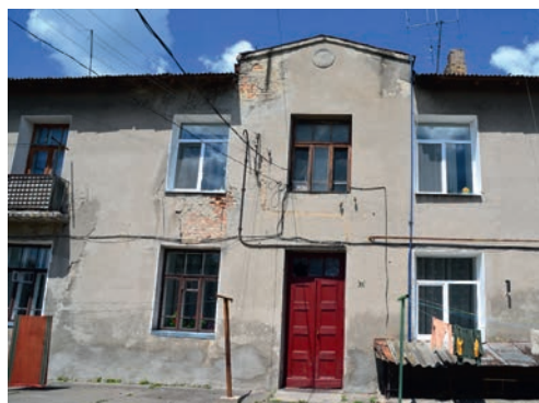
Ілюстр. 6. Колишній вірменський храм у Луцьку (нині це житловий будинок за адресою вул. Галшки Гулевичівни, 12)