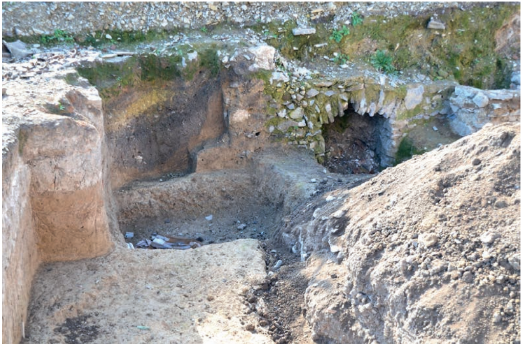
Ілюстр. 1. Залишки житлових об'єктів по вул. Зарванській, 7/1 у Кам'янці-Подільському