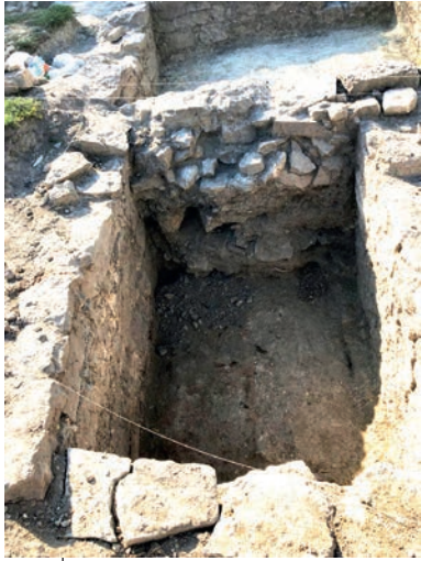
Ілюстр. 7. Склепик Покровської церкви у замку Кам'янець-Подільського