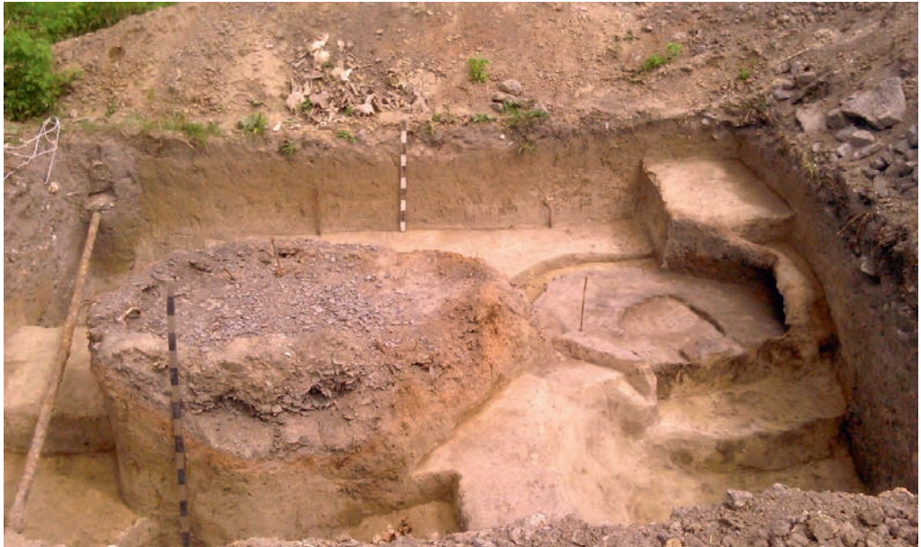
Ілюстр. 11. Залишки гончарного горна з вул. Троїцької, 4а в Кам'янці-Подільському