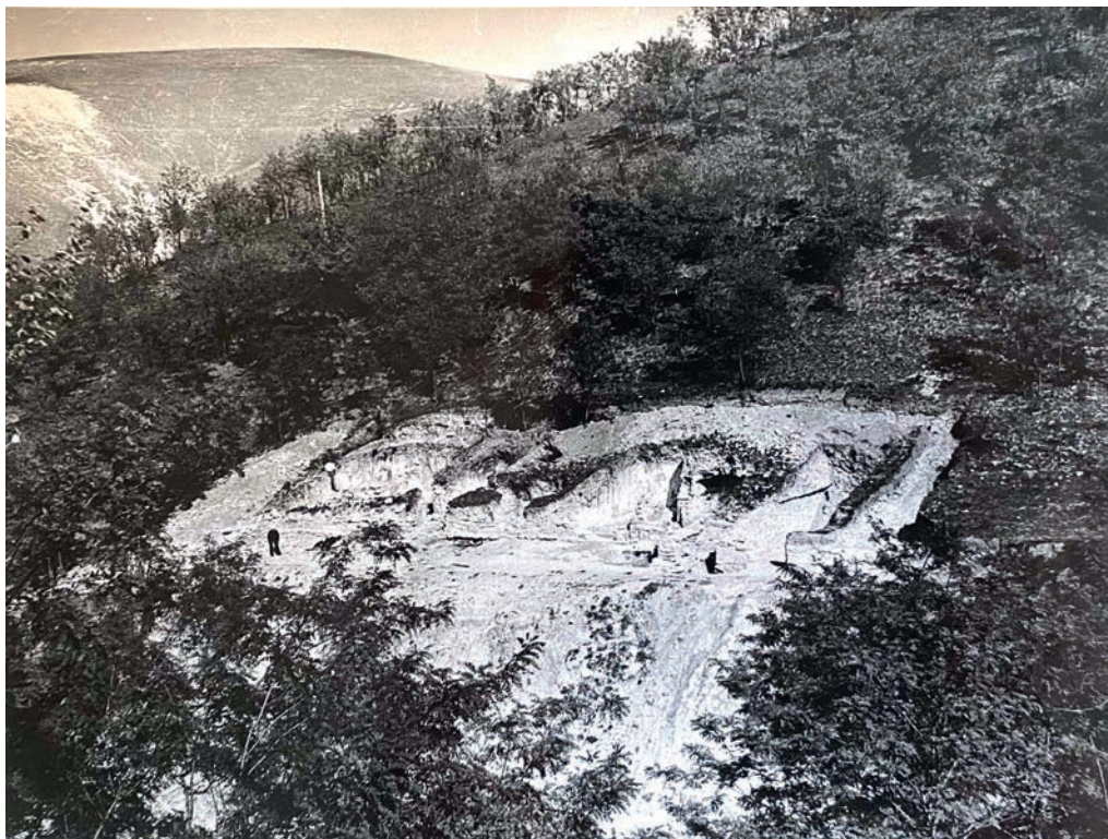
Ілюстр. 4. Початок дослідження палацового комплексу в Бакоті (фото 1964 р.)