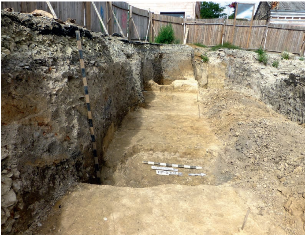
Ілюстр. 12. Залишки житлових об'єктів і гончарного горна з вул. Зарванської, 7/1 у Кам'янці-Подільському