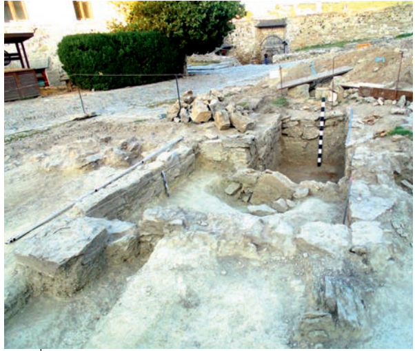
Ілюстр. 8. Залишки фундаментів Покровської церкви у замку Кам'янець-Подільського