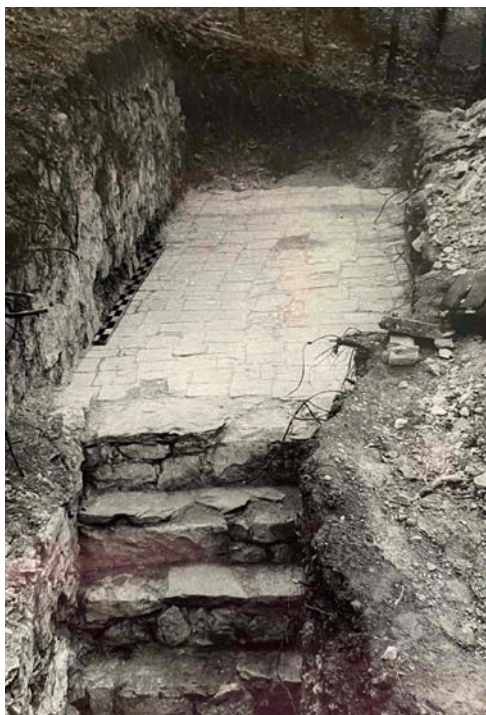
Ілюстр. 5. Сходи та мощення плиткою з вапняку в Бакітському палаці (фото 1963 р.)